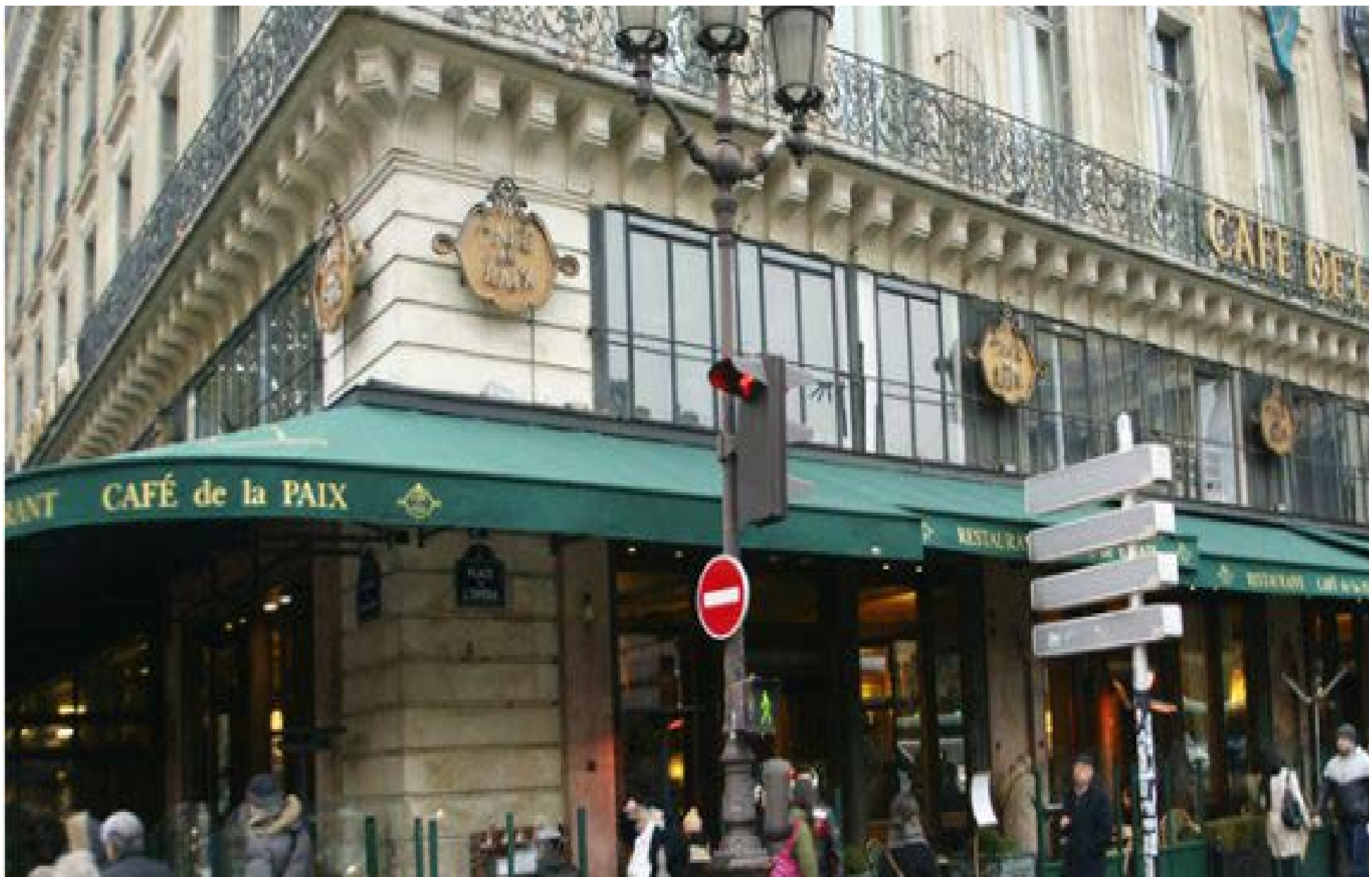
Café de la Paix

Amateurs. Se pegaba a los cristales del local para mirar, como un chicle travieso, curioso y divertido, el interior. En aquella época -los años veinte- este punto de encuentro vivía atestado de fumadores -hombres y mujeres por igual-. Nubes de humo envolvían el local hasta hacerlo oscuro e insoportable. La gente bebía hasta hartarse de su propia manía de beber. Pero el café tenía el embrujo de atraer gente y mantenerla atada durante horas.