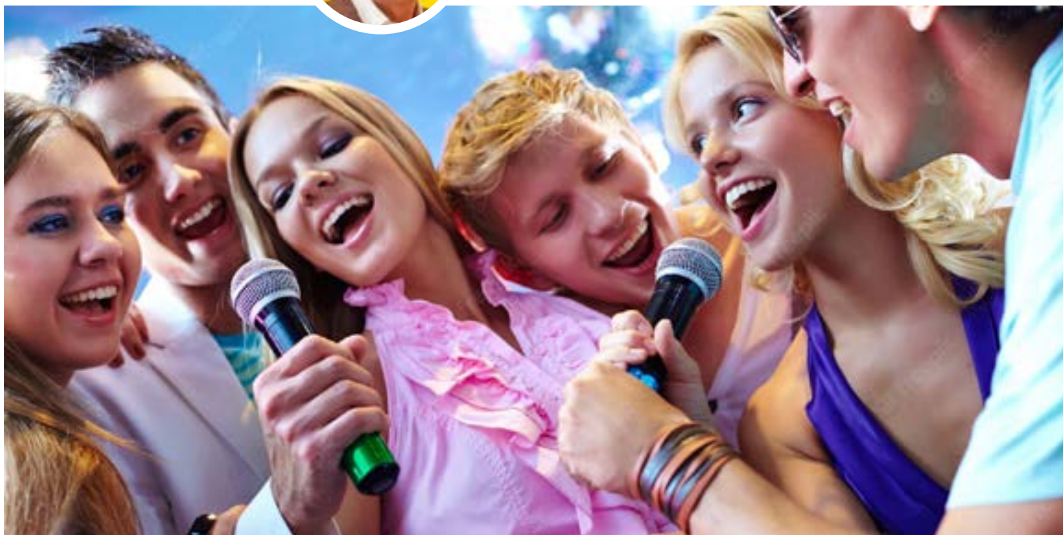
La felicidad de la gente.

La revista HARVARD DEUSTO Management & innovation del mes de octubre de 2022, trae una entrevista con el profesor de Psicología Positiva Tal Ben-Shahar, explica como y por qué los ejecutivos deben apostar por el bienestar emocional de sus colaboradores. Estos son algunas de las respuestas que el profesor entregó a la revista.