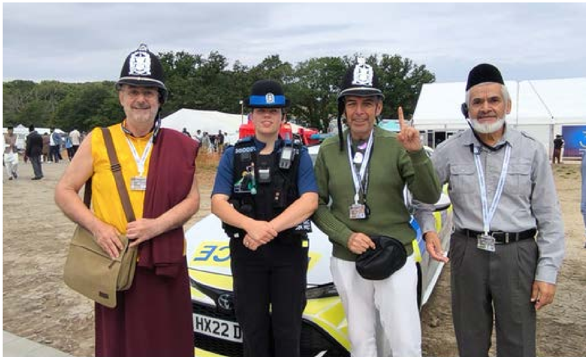
Una jefa de la policía de Londres encargada de la seguridad de la Convención Mundial Musulmana nos prestó y se fotografió con nosotros, luciendo prendas de su institución.