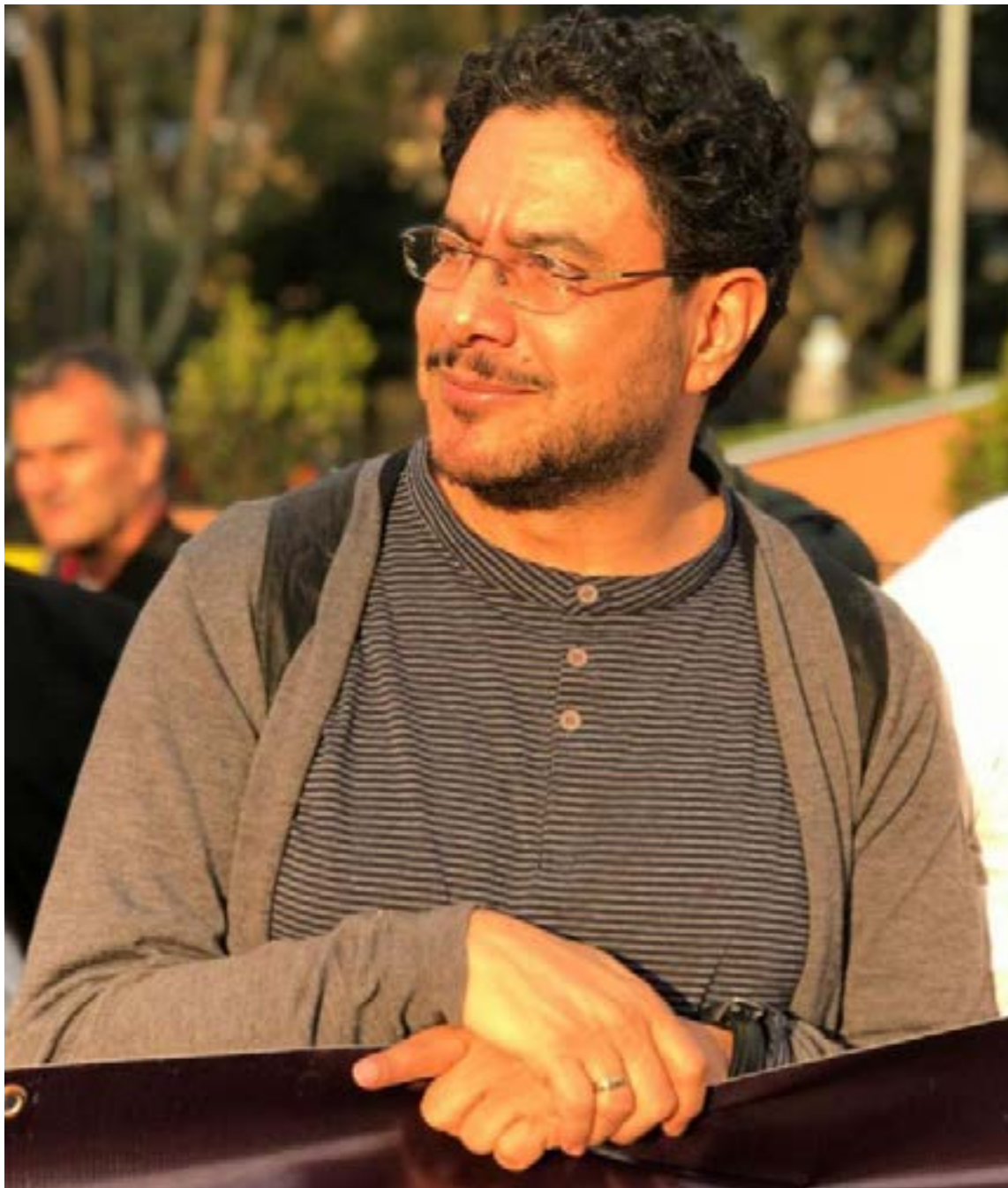
Iván Cepeda, senador de la República

maciones, Cepeda hizo referencia a unos audios revelados por el periodista Daniel Coronell en su espacio de análisis en La W Radio. En estos audios, se habla de un supuesto «montaje judicial» que se estaría fraguando con el apoyo de agencias de investigación extranjeras como la DEA y el FBI.