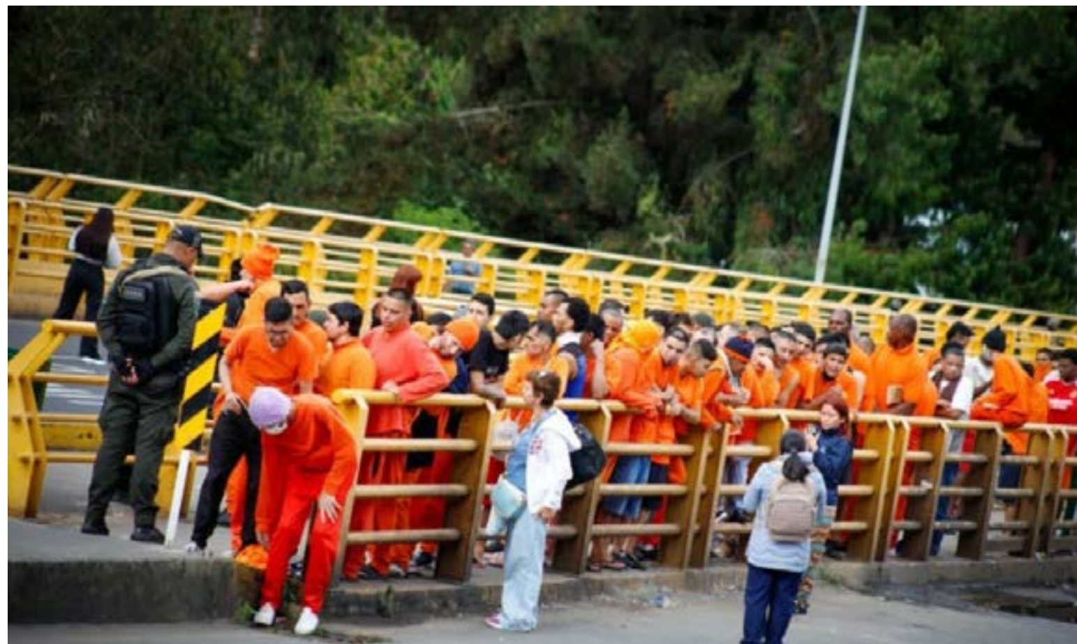
El ultraderechista presidente de Ecuador, Daniel Noboa, deportó a ciudadanos colombianos, uniformados como presos. En respuesta, el presidente Petro expresó su protesta ante este acto considerado inamistoso.

En otras palabras, es una pelea entre malos vecinos. Pero tampoco es un chiste porque no se puede tirar por la borda un nexo como el de Ecuador y Colombia aunque Noboa sea un oligarca propietario, de los que detesta Petro y nuestro presidente es un guerrillero izquierdista en ejercicio, como a los que no puede ver Noboa.