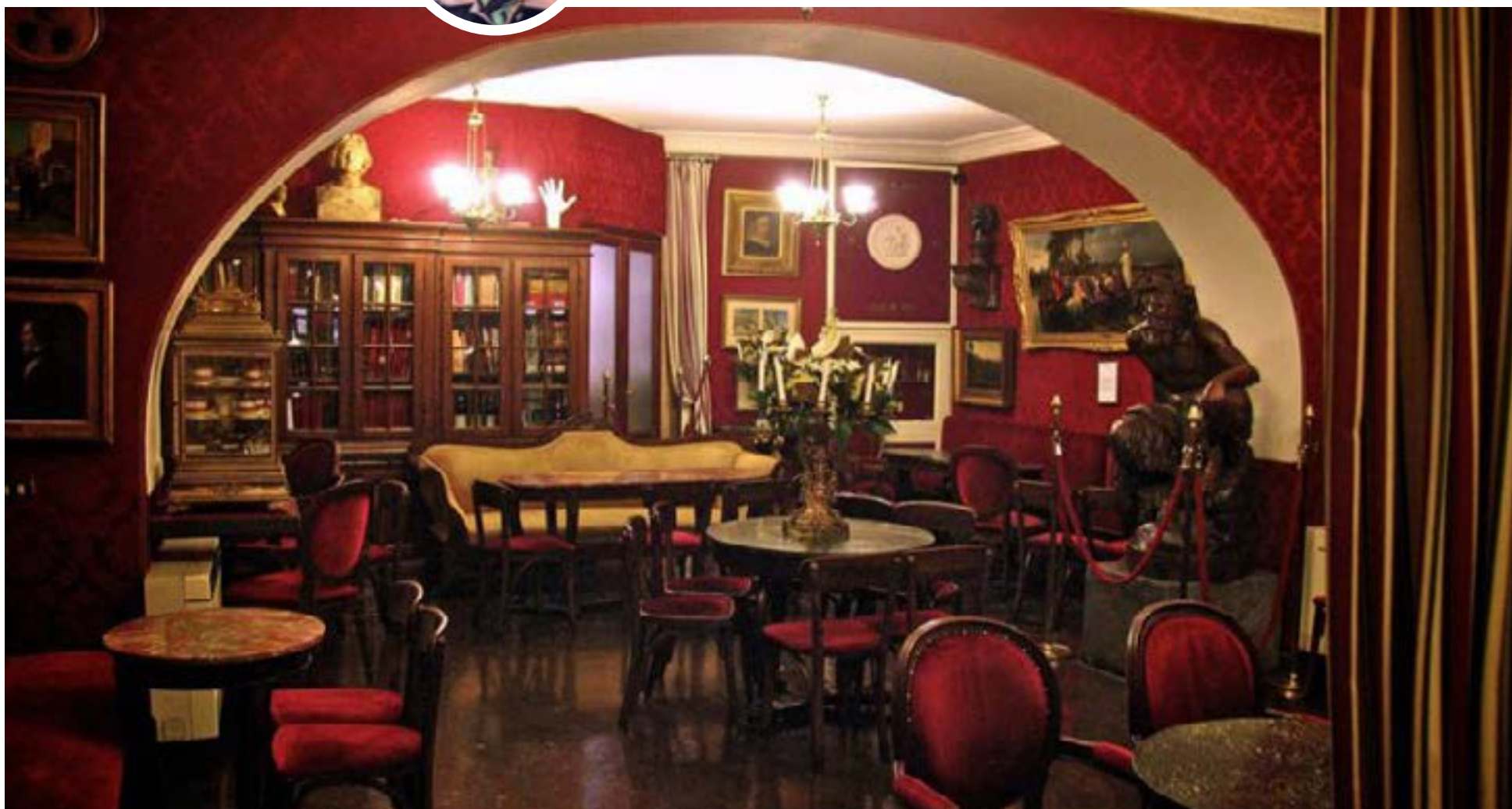
Antico Caffè Greco

R ecorrimos a pie la Avenida de los Campos Elíseos, una mañana del mes de diciembre, en la soñada y romántica París. El frío atormentaba la piel y los huesos; marchitaba los cabellos; arañaba hasta el más débil pensamiento que teníamos. Encontramos un café abierto, sencillo y elegante, con las mesas y sillas puestas en el andén. Nos sentamos adentro huyendo del helado aire que soplabla. Transcurría la temporada invernal.