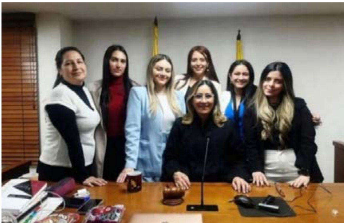
El equipo de la jueza 44 de Bogotá, conformado por mujeres, trabajó arduamente en el denominado «Juicio del Siglo».

Como cuando le dijo en plena audiencia al expre-